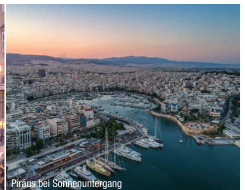
Piräus bei Sonnenuntergang