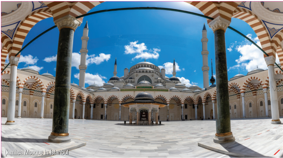
Çamiya Mosque in Istanbul