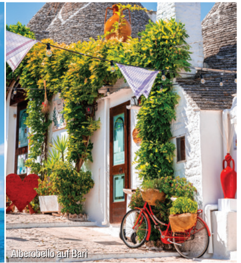
Alberobello auf Bari