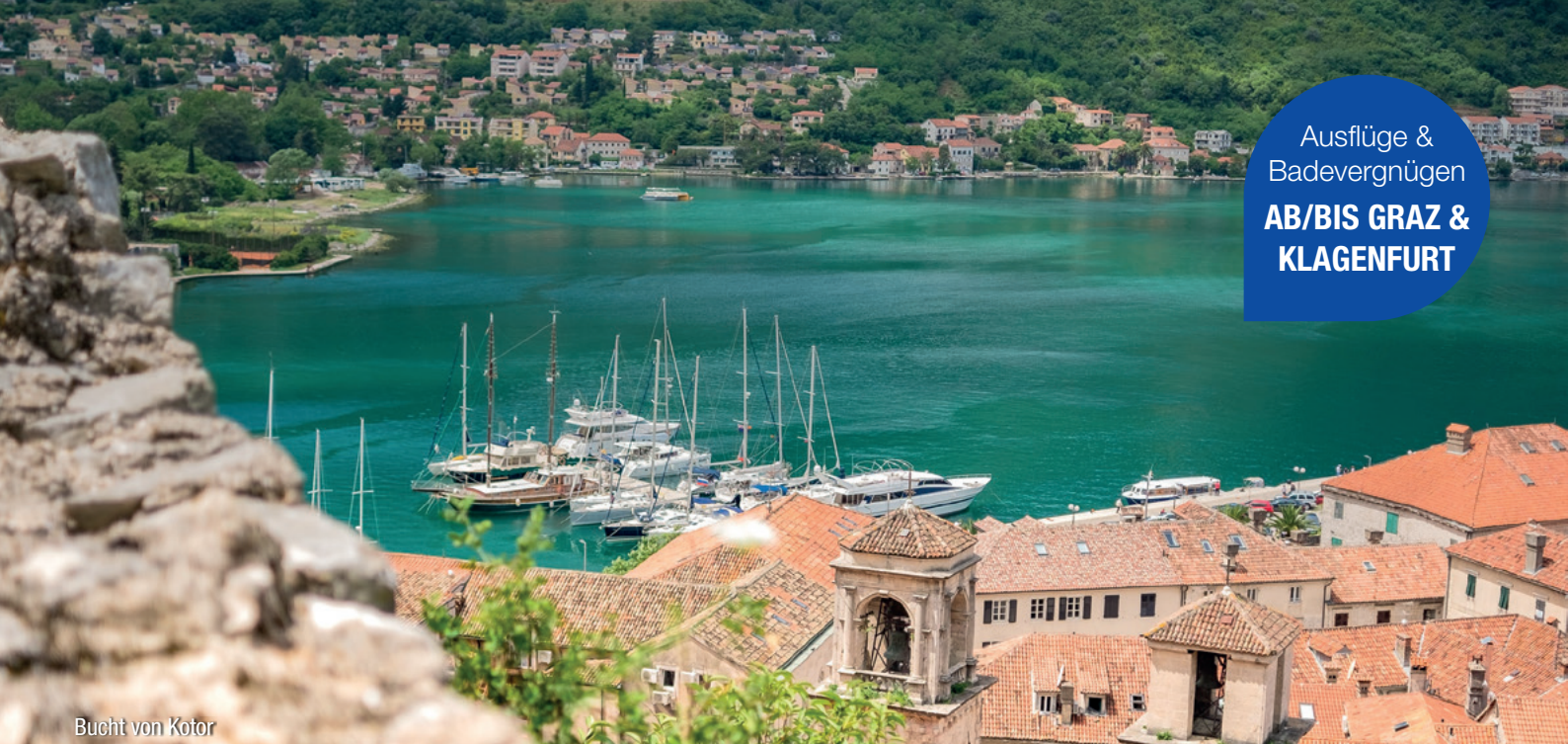
Bucht von Kotor

Ausflüge & Badevergnügen AB/BIS GRAZ & KLAGENFURT