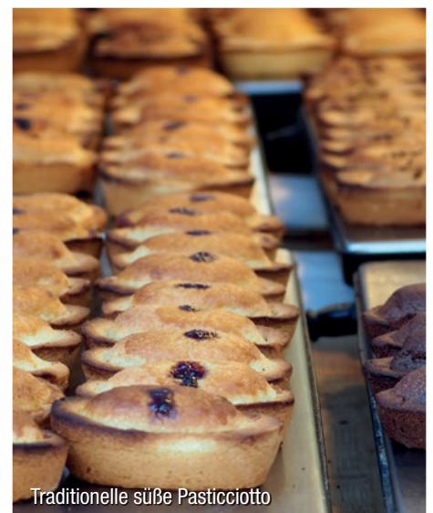
Traditionelle süße Pasticciotto

im Doppelzimmer 1.490,- Einzelzimmerzuschlag 360,-