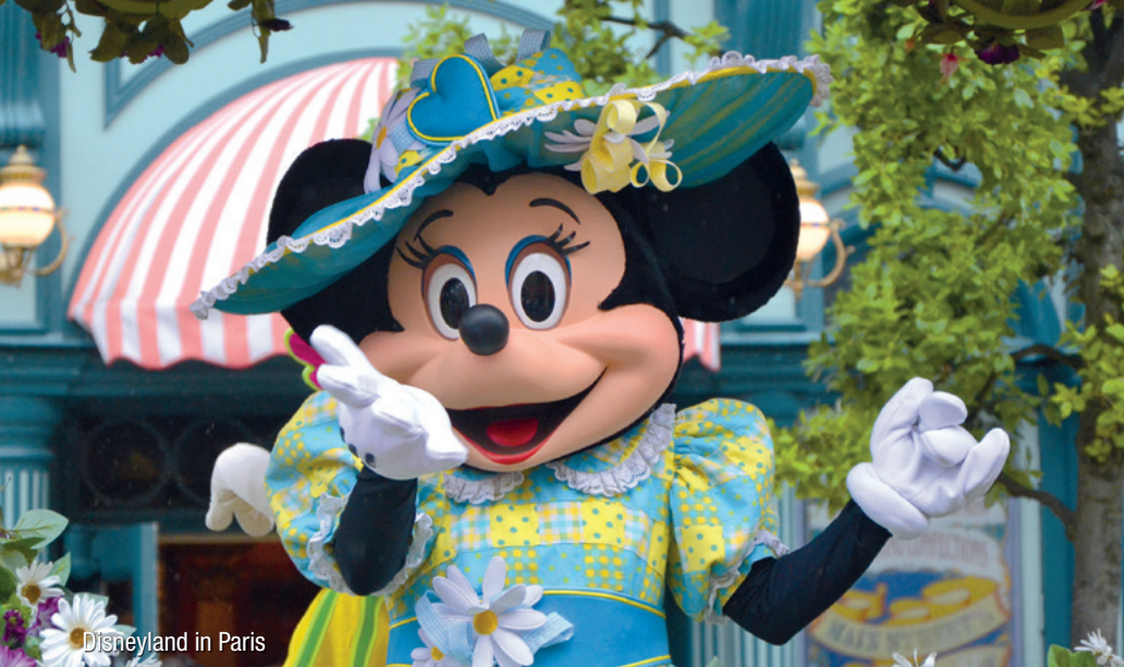
Disneyland in Paris