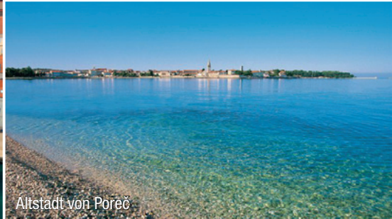
Altstadt von Poreč