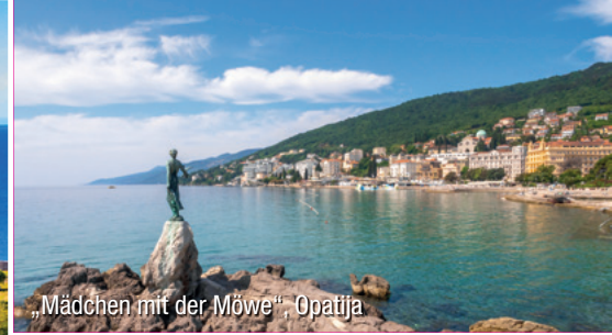
„Mädchen mit der Möwe“, Opatija