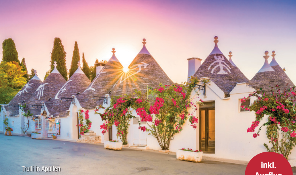
Trulli in Apulien