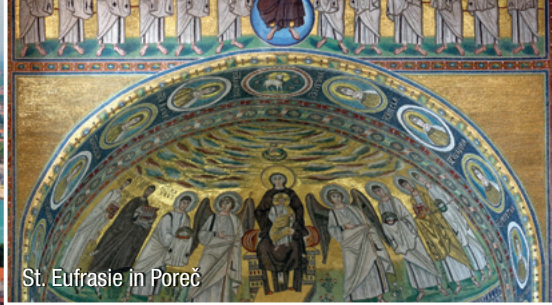
St. Eufrasie in Poreč