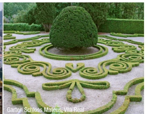
Garten Schloss Mateus, Vila Real