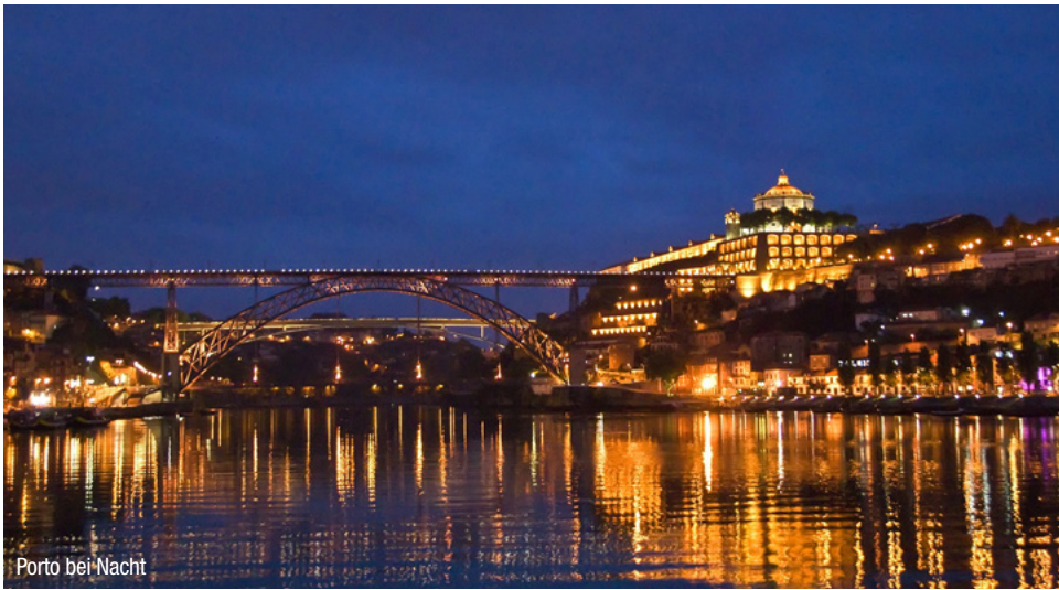
Porto bei Nacht