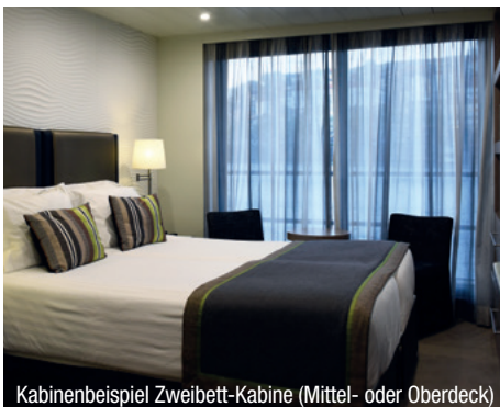
Kabinenbeispiel Zweibett-Kabine (Mittel- oder Oberdeck)