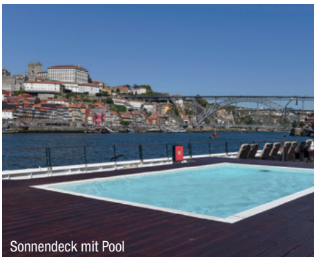
Sonnendeck mit Pool