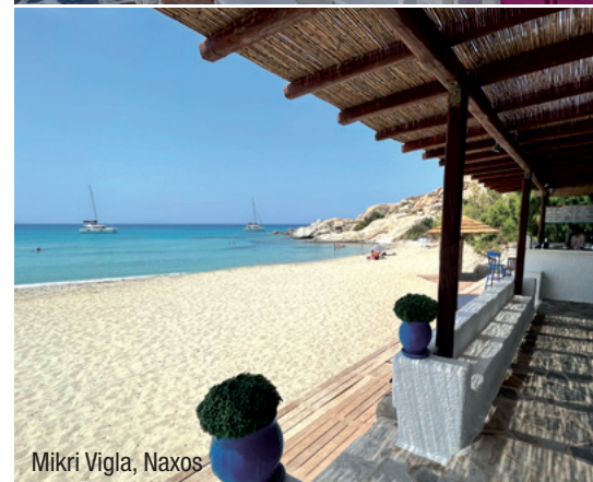
Mikri Vigla, Naxos