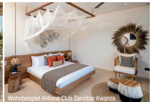
Wohnbeispiel Aldiana Club Zanzibar Kwanza

Preis-, Termin- und Programmänderungen vorbehalten.