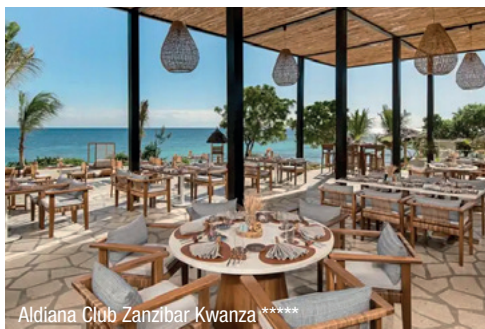
Aldiana Club Zanzibar Kwanza *****