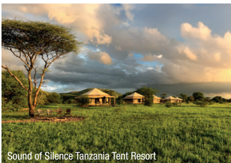
Sound of Silence Tanzania Tent Resort

17.00 Uhr ab Sansibar – 19.35 Uhr an Addis Abeba, 00.35 Uhr ab Addis Abeba – 04.55 an Wien